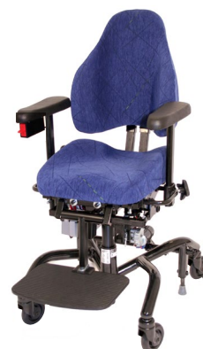
⊕ REAL® 9000 PLUS KIND EL