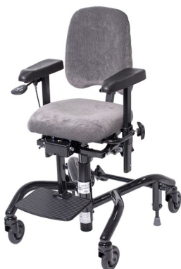
⊕ REAL® 9000 PLUS KIND

Der REAL 9000 PLUS KIND wurde vom Schwedischen Technischen Forschungsinstitut SP getestet und gemäß DIN-EN 1335, 1–3 zugelassen. Zudem besitzt der Stuhl die CE-Kennzeichnung und erfüllt die schwedischen Anforderungen an medizintechnische Produkte sowie die des schwedischen Staatlichen Amtes für Arzneimittelwesen. Die hohen Qualitätsanforderungen gewährleisten zudem jahrelange Sicherheit im Gebrauch.